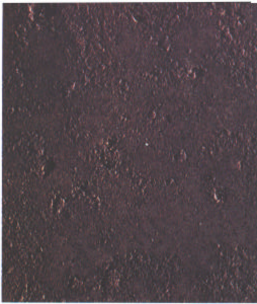
D Sa 1