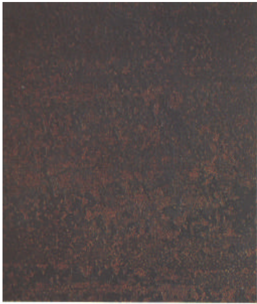
B St 2