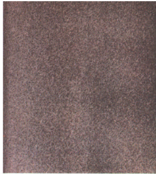
C Sa 2