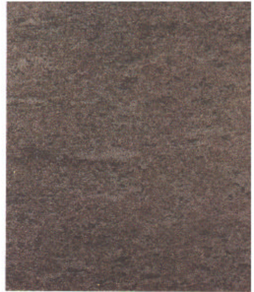
B Sa 2