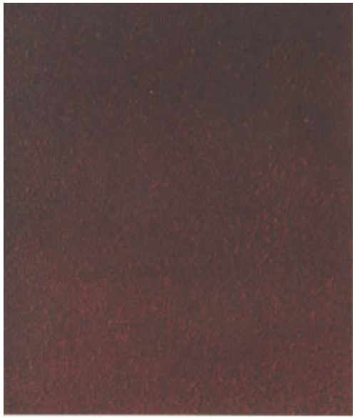
C Sa 1