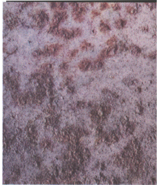
D Sa 2