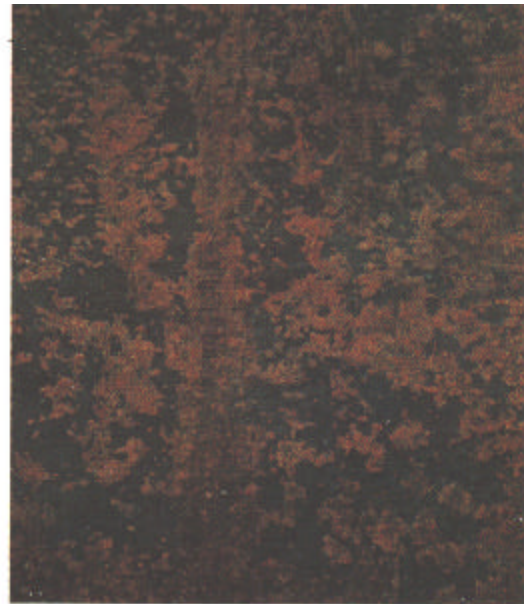
B St 3