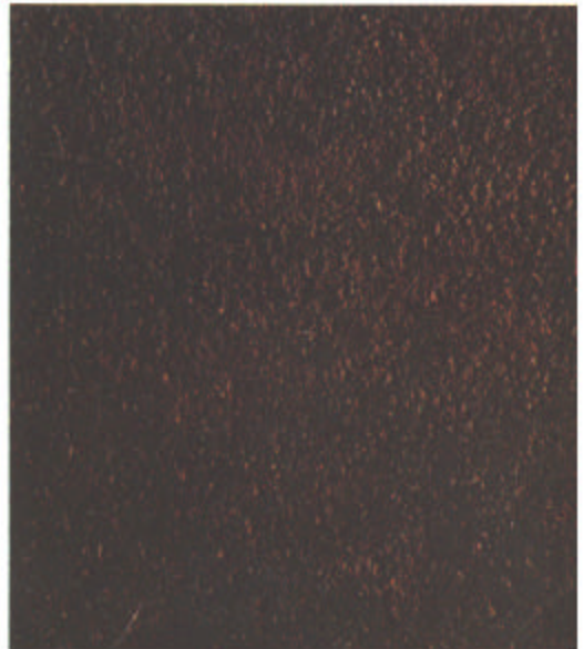
D St 3