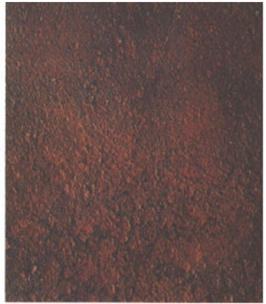
D St 2