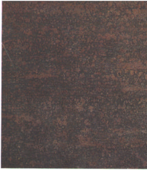
B Sa 1